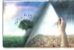
( ب )